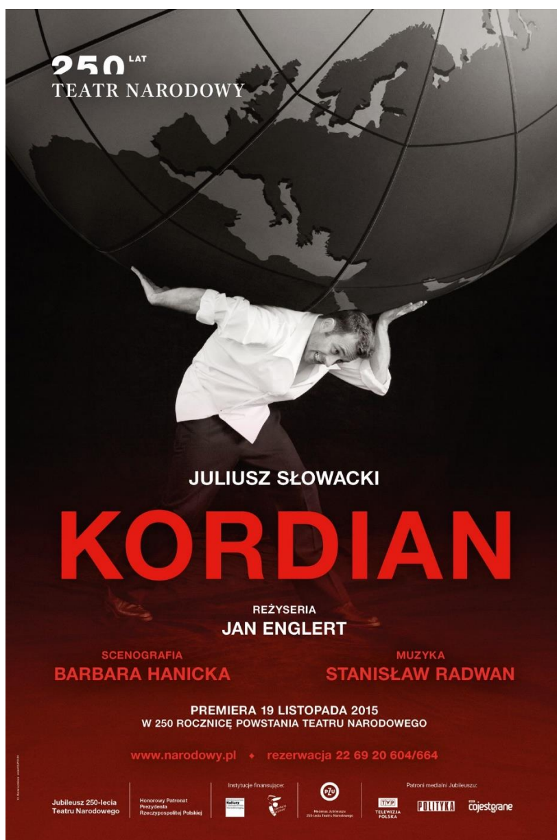
Plakat do przedstawienia Kordian – fot. Maciej Landsberg, projekt: Elipsy, Archiwum Artystyczne Teatru Narodowego, www.narodowy.pl

Zapoznaj się z plakatem do przedstawienia Kordian według dramatu Juliusza Słowackiego. Ознайомся з плакатом до вистави «Кордіан» за драмою Юліуша Словацького.